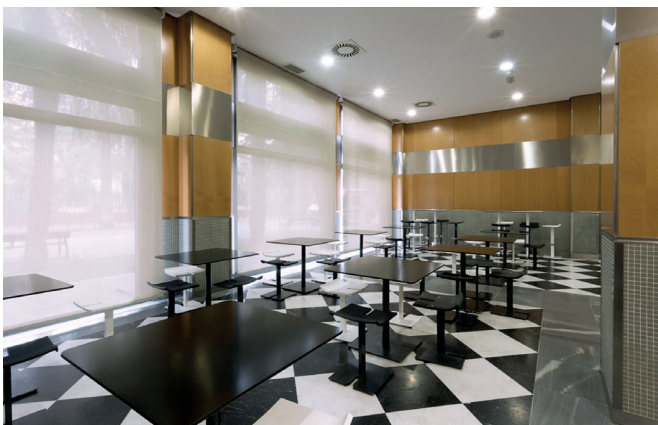
Cafetería. Edificio D, planta baja.

• Edificio D , planta baja. Horario: de 8:00h. a 16:00h. , de lunes a viernes.