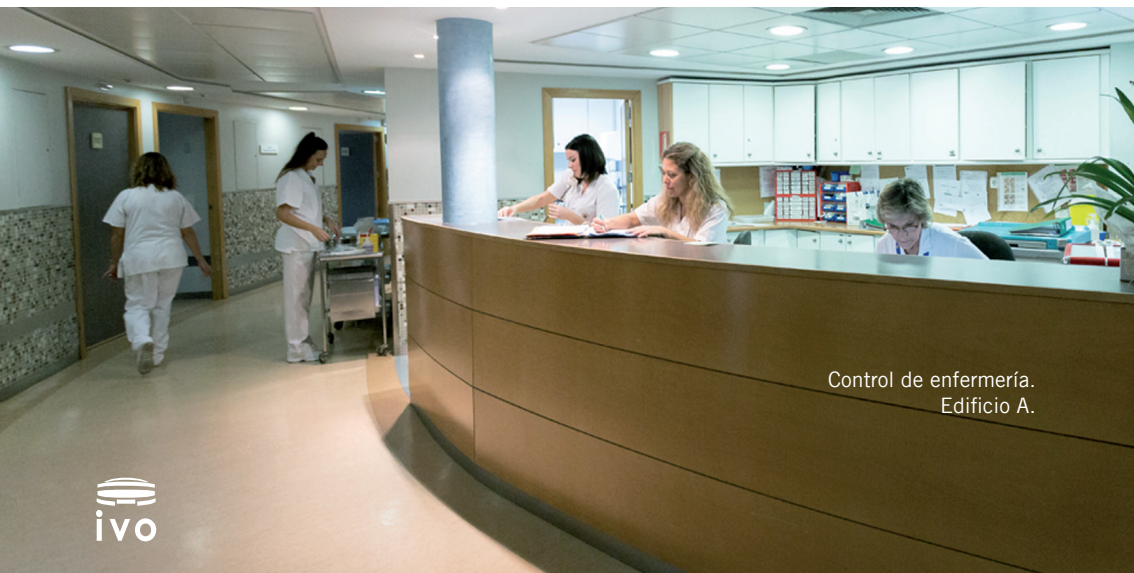
Control de enfermería. Edificio A.